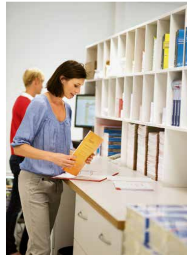
Haben bisher etwa 1800 Seminare organisiert: W.A.F.-Mitarbeiter in Tutzing

Das W.A.F. Institut macht Betriebsräte fit für ihre Aufgaben. Für das eigene Team schafft die Einrichtung fast schon ein familiäres Klima. Das kommt bei den Mitarbeitern gut an